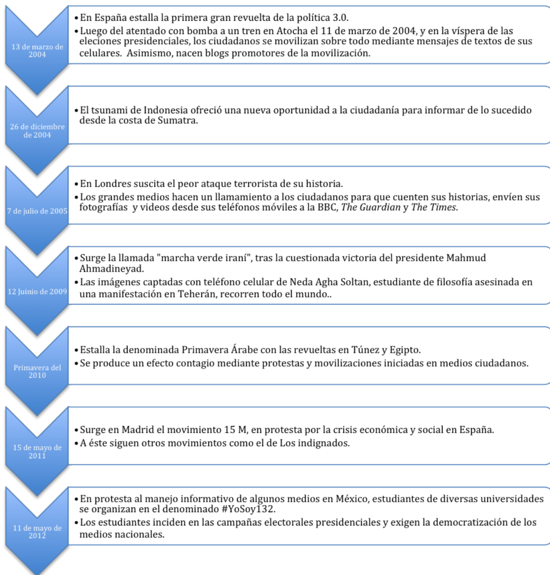
FIGURA 2. CRONOLOGÍA

“El periodismo ciudadano puede servir para preservar la diversidad cultural de los pueblos, un objetivo de vital importancia en aquellos países en vías de desarrollo donde existen un gran número de etnias y dialectos diferentes. Es una manera de poner en manos de las pequeñas comunidades las herramientas necesarias para su desarrollo”, explica Espiritusanto (2011, p. 23).